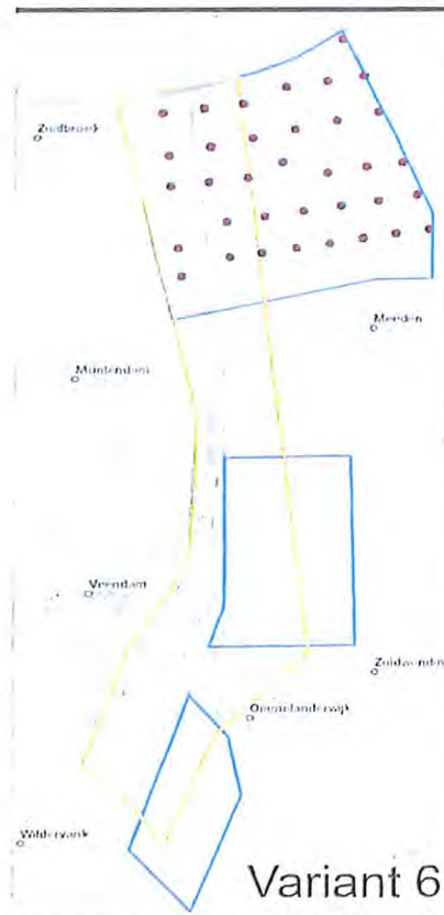
Verbeelding variant 6

DATUM 25 april 2017 ONS KENMERK 267773 PAGINA 26 van 40